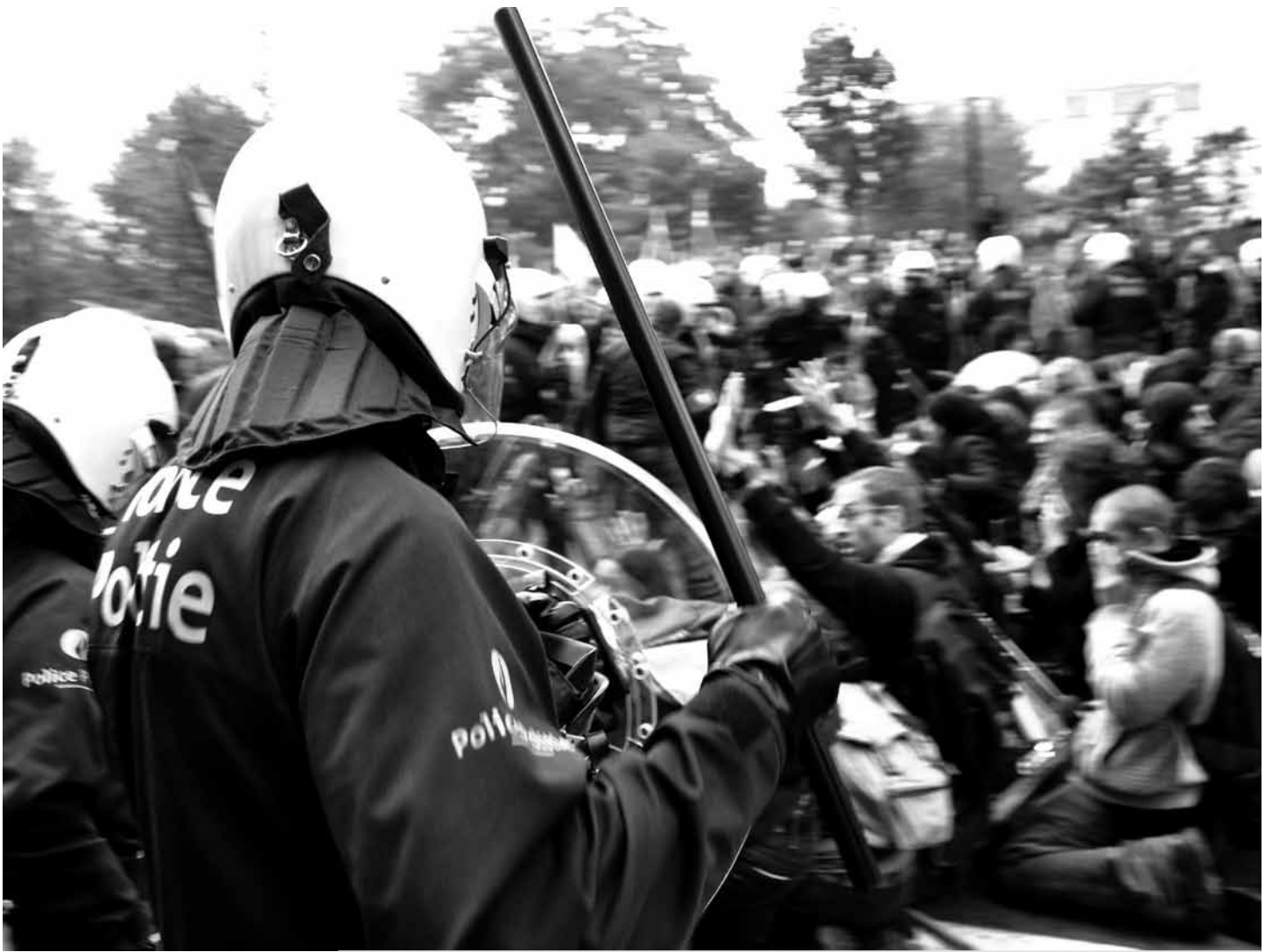
AU LOOK! ARRESTATIONS PRÉVENTIVES DE MASSE. BRUXELLES, 29.09.2010

magnifiquement saisi ce mariage du pouvoir et du savoir (médical) dans son livre "Histoire de la folie à l'âge classique" ①. De cette approche sont nées les législations de défense sociale qui écartaient les fous loin de la société.